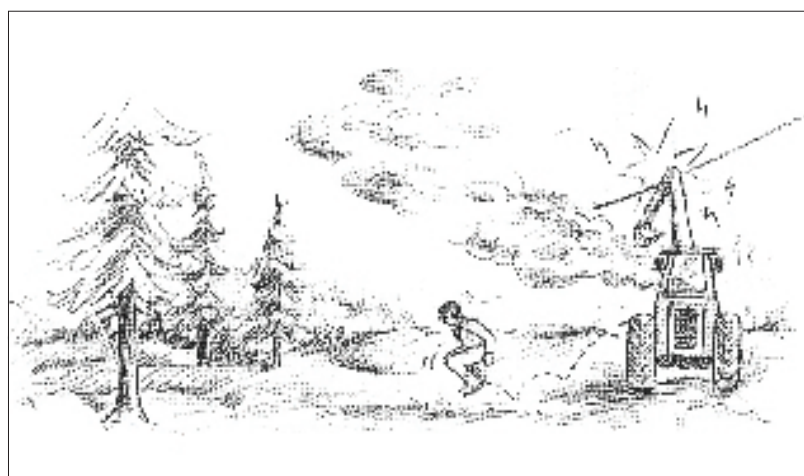
Oppstår det uhell er det viktig at maskinen forlates på riktig måte.

Utsiktet berøring med strømførende høyspenningsledninger i forbindelse med anleggsarbeid kan få alvorlige konsekvenser for liv og helse. Det kan også medføre store økonomiske kostnader for samfunnet fordi høyspenningsledninger må kobles ut for å rette opp feil. Dette fakta-arket tar for seg hvordan en kan unngå at farlige situasjoner oppstår, og hva en bør gjøre dersom anleggsmaskiner kommer i berøring med høyspenningsledninger eller det skjer overslag uten direkte berøring.